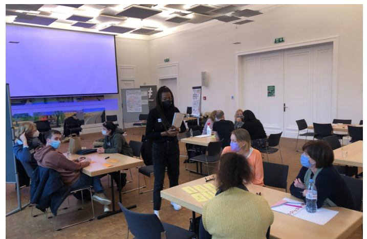
Am Samstag fand die Fortbildung "Rassismuskritisches Denken und Handeln im Schulunterricht" in Dudelange statt.