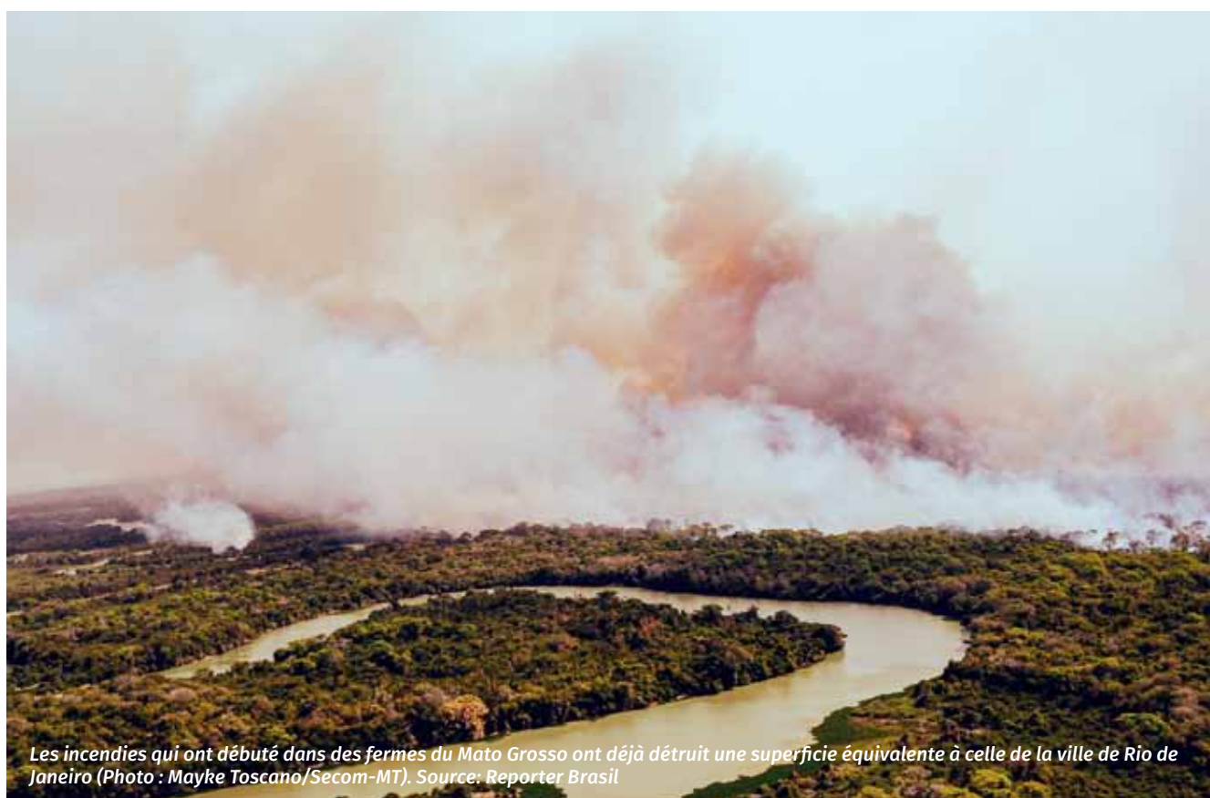
Les incendies qui ont débuté dans des fermes du Mato Grosso ont déjà détruit une superficie équivalente à celle de la ville de Rio de Janeiro.

Les grands complexes de soja, de bétail, de bois et d'infrastructures associées (ports, routes, chemins de fer) sont les principaux acteurs de l'expansion de la frontière agricole dans cette région.