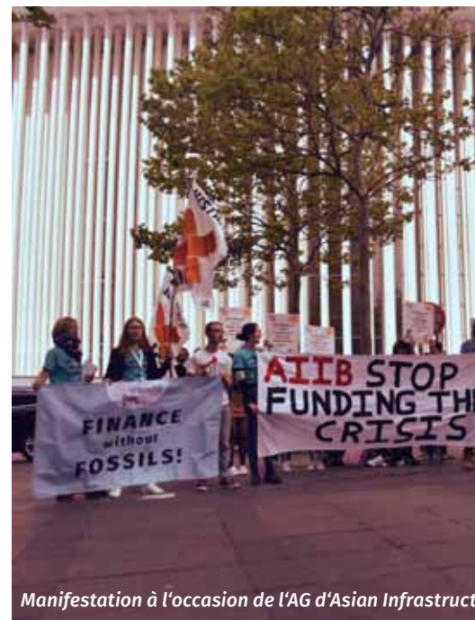
Manifestation à l'occasion de l'AG d'Asian Infrastruct

Pacifique, la BAD est dans une position unique pour influencer les pratiques de développement des pays de la région et elle est fière d'être considérée comme une institution qui «continue d'avoir un impact positif sur la vie des pauvres dans la région Asie-Pacifique, car elle aide les pays à atteindre leurs objectifs de développement». Cependant, elle a été régulièrement critiquée par les organisations de la société civile pour ses politiques favorables aux grandes entreprises, la promotion de la privatisation des services sociaux, la déréglementation des secteurs économiques et le financement de projets non durables sur le plan social et environnemental.