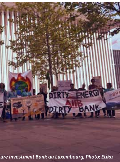
Structure Investment Bank au Luxembourg

La réponse COVID-19 de la Banque asiatique de développement peut se résumer à la fourniture d'un financement du développement visant à fournir les biens publics mondiaux dont les entreprises tirent le plus de profits.