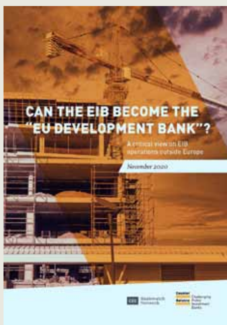
Counter Balance's report

and truly becoming a sustainable, transparent and accountable institution. Over the years we have identified a number of structural issues ranging from insufficient attention to human rights and environmental impacts, to a lack of public ownership, transparency and control over funds. These issues still need to be addressed.