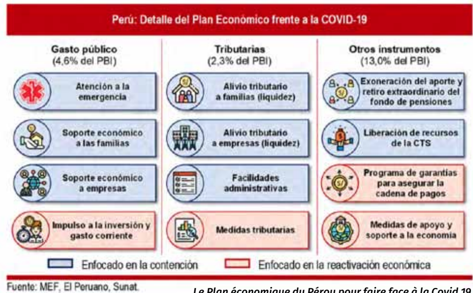
Le Plan économique du Pérou pour faire face à la Covid 19

Face à ce paradoxe, on se demande s'il n'aurait pas été plus cohérent d'investir ces économies au préalable, plutôt que de faire face à la pandémie avec ces énormes lacunes institutionnelles, de services et d'infrastructures publiques. De même, la nécessité d'engager une véritable réforme fiscale qui puisse donner à l'État péruvien une viabilité et les moyens pour répondre à ses obligations sociales devient de plus en plus évidente.