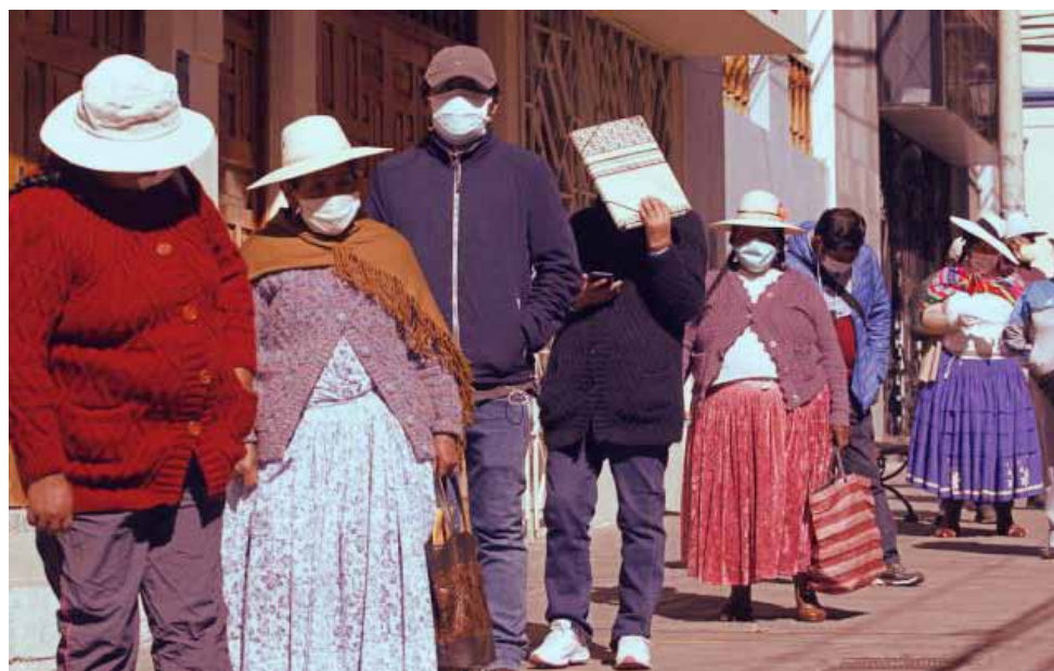
Des personnes attendent pour recevoir les bons de l'Etat péruvien «Je reste à la maison».

types de faiblesses institutionnelles ont également été révélées et ont empêché une réponse adéquate à la pandémie, comme par exemple le degré élevé du travail informel, qui atteint 70% ; la faiblesse de l'infrastructure de communication, qui a mis en évidence les énormes écarts numériques ; la