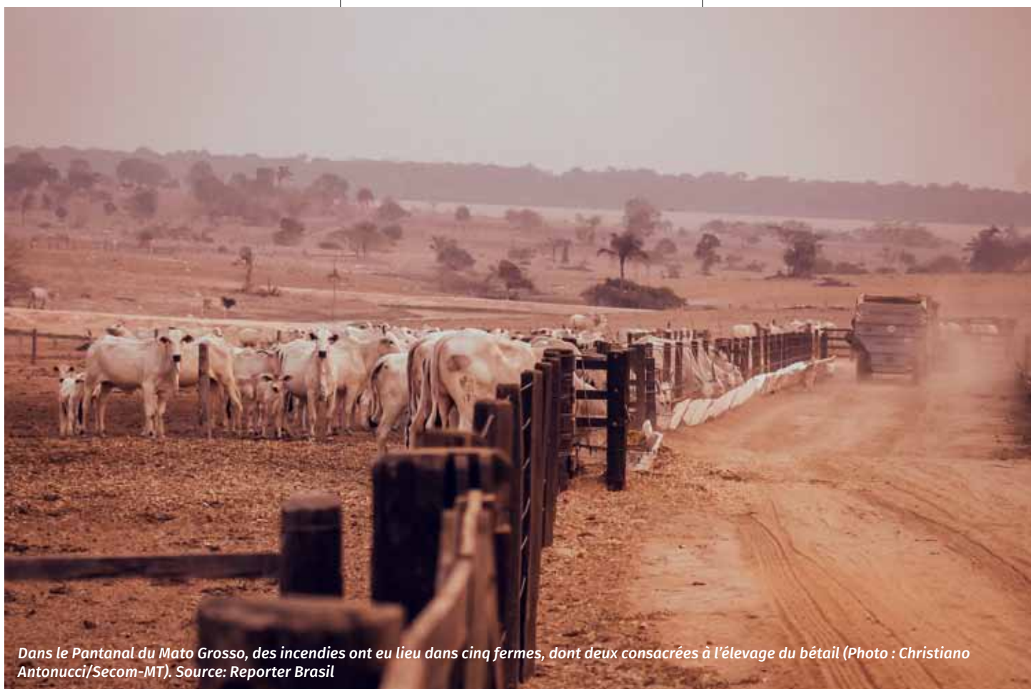
Dans le Pantanal du Mato Grosso, des incendies ont eu lieu dans cinq fermes, dont deux consacrées à l'élevage du bétail.

Pour sa part, les incendies survenus dans les Sierras de Córdoba, -