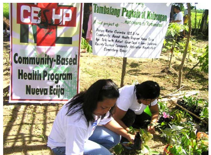
Réalisation d'un potager et culture de plantes médicinales à Guimba

Dès 2007 la région a été touchée par une présence militaire intensive qui a entraîné des cas fréquents d'atteinte aux droits humains parmi la population civile; souvent les membres d'organisations populaires et des ONG étaient considérés par les militaires comme des organisations terroristes et ou communistes. Dans ce contexte, les activités des projets entre 2008 et 2014 ont été adaptées afin de fournir des interventions psychosociales destinées aux personnes et communautés traumatisées par les atrocités de l'armée.