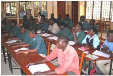
En 2014, le CIDAP, a été sélectionné comme exemple de bonne pratique dans le domaine de la formation technique et professionnelle agricole par la coopération allemande via la GIZ (Deutsche Gesellschaft für Internationale Zusammenarbeit).