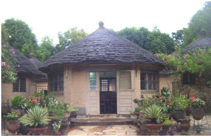
Le CIDAP a construit au fil des années un centre de formation et d'accueil en moyenne 800 personnes par an.