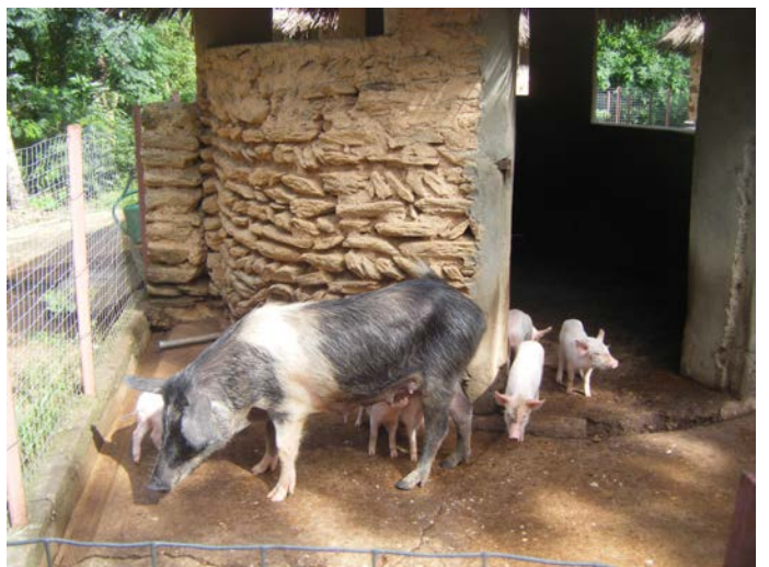
Cochons, pintades, poules et chèvres font partie de la chaîne agro-écologique pratiquée et enseignée au CIDAP depuis plus de 20 ans.