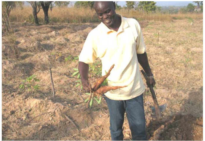
Augmenter la production en polyculture de légumes, céréales, légumineuses et fruits sans pesticides et intrants chimiques contribue à la sécurité alimentaire et l'amélioration de l'état de santé des populations locales.