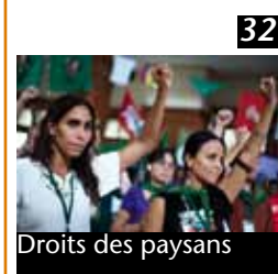
32 Droits des paysans Un nouvel instrument juridique international