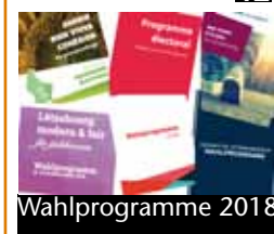
42 Wahlprogramme 2018 Friede, Freude, Eierkuchen