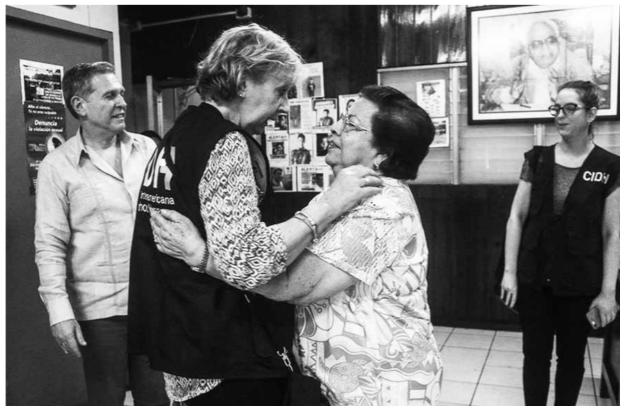
Mission de la CIDH au Nicaragua en 2018

Face à cette situation, les mouvements de défense des droits des femmes ont joué un rôle clé pour rendre visibles les multiples formes de violence et pour faire progresser le respect et la garantie de leurs droits. C'est pourquoi les défenseurEs des droits humains sont chaque jour victimes d'insultes, de menaces et même de meurtres. Récemment, les femmes de la région ont été les protagonistes de mouvements de grande envergure, tels que la plateforme #Niunamenos - rejetant les meurtres de femmes et l'impunité qui les entoure - ou la "vague verte" en Argentine, exigeant davantage de droits sexuels et reproductifs. Ces mouvements se sont étendus à toute la région et ont contribué à maintenir la lutte pour les droits des femmes sur les agendas nationaux et internationaux.