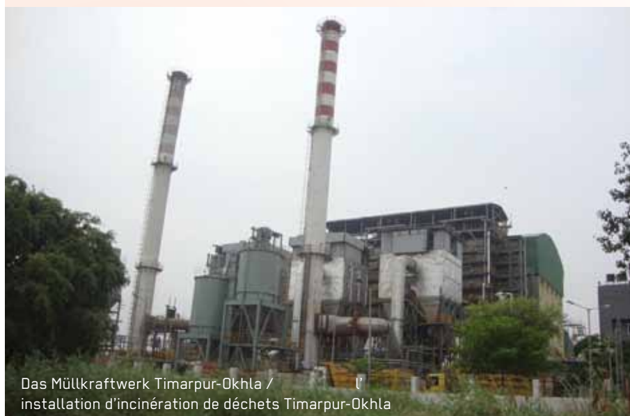
Das Müllkraftwerk Timarpur-Okhla / installation d'incinération de déchets Timarpur-Okhla