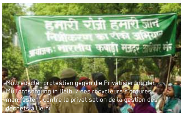
Müllrecycler protestieren gegen die Privatisierung der Müllentsorgung in Delhi / des recycleurs d'ordures manifestent contre la privatisation de la gestion des déchets à Delhi