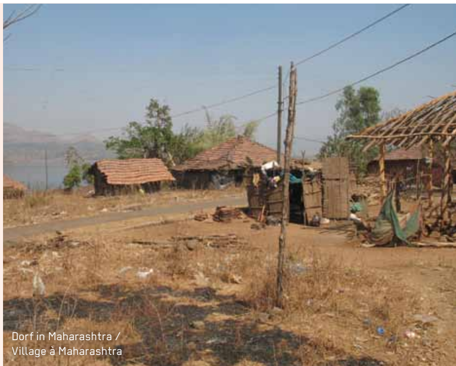
Dorf in Maharashtra / Village à Maharashtra

Dans les campagnes, de nombreux pauvres migrent dans les agglomérations urbaines grandissantes et rejoignent la foule des journaliers du secteur informel (v. p. 8) qui mènent une existence précaire