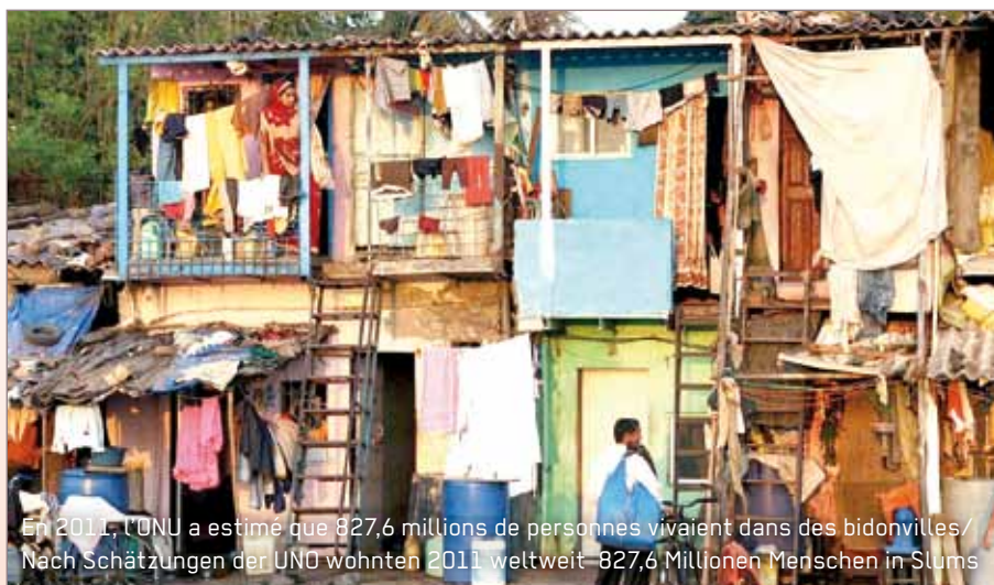
En 2011, l'ONU a estimé que 827,6 millions de personnes vivaient dans des bidonvilles / Nach Schätzungen der UNO wohnten 2011 weltweit 827,6 Millionen Menschen in Slums