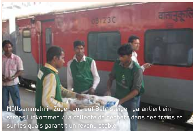
Müllsammeln in Zügen und auf Bahnsteigen garantiert ein stetes Einkommen / la collecte de déchets dans des trains et sur les quais garantit un revenu stable

Chintan tente de persuader des entreprises de la capitale de faire éliminer leurs déchets de manière écologique et équitable par des recycleurs reconnus et offre aux firmes intéressées des formations continues sur la gestion des déchets.