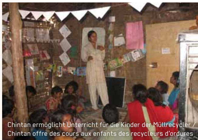
Chintan ermöglicht Unterricht für die Kinder der Müllrecycler / Chintan offre des cours aux enfants des recycleurs d'ordures