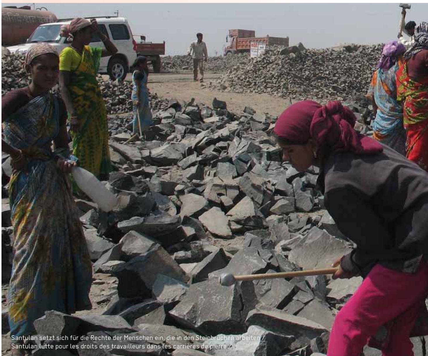
Santulan setzt sich für die Rechte der Menschen ein, die in den Steinbrüchen arbeiten / Santulan lutte pour les droits des travailleurs dans les carrières de pierre /

L'amélioration des conditions de vie et de travail des travailleurs du secteur informel compte parmi les priorités et engagements de l'ASTM en Inde. Ainsi, nous soutenons depuis 2001 l'organisation Santulan qui défend les droits des communautés qui vivent dans des conditions effroyables dans les carrières autour de la ville de Pune dans l'ouest du pays. Plus d'informations sur www.astm.lu/