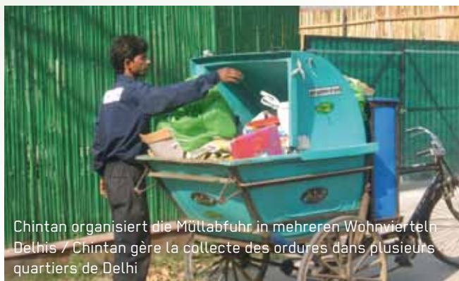
Chintan organisiert die Müllabfuhr in mehreren Wohnvierteln Delhis / Chintan gère la collecte des ordures dans plusieurs quartiers de Delhi