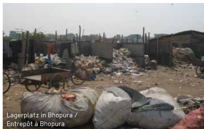
Lagerplatz in Bhopura / Entrepôt à Bhopura