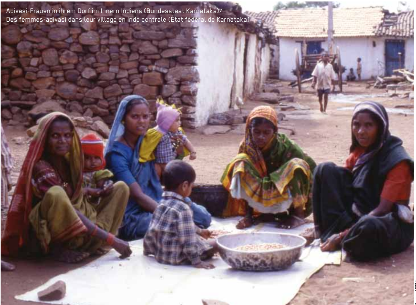
Adivasi-Frauen in ihrem Dorf im Innern Indiens (Bundesstaat Karnataka)/ Des femmes-advasi dans leur village en Inde centrale (État fédéral de Karnataka)