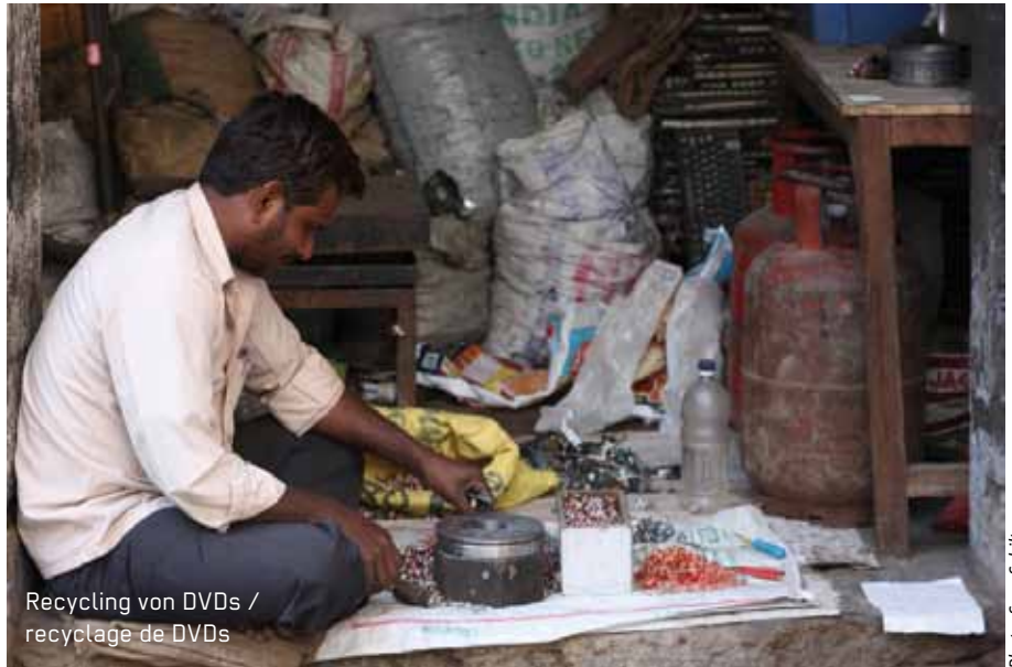
Recycling von DVDs / recyclage de DVDs

Ein Folgeprojekt ab Januar 2013 ist in Vorbereitung, das die Müllrecycler in ihrem Widerstand gegen die Privatisierung der Müllentsorgung mit Verbrennungsanlagen und „Clean Development Mechanism“-Projekten stärkt und die Öffentlichkeitsarbeit von Chintan mit Informationsblättern, Kurzfilmen u.a. unterstützt.