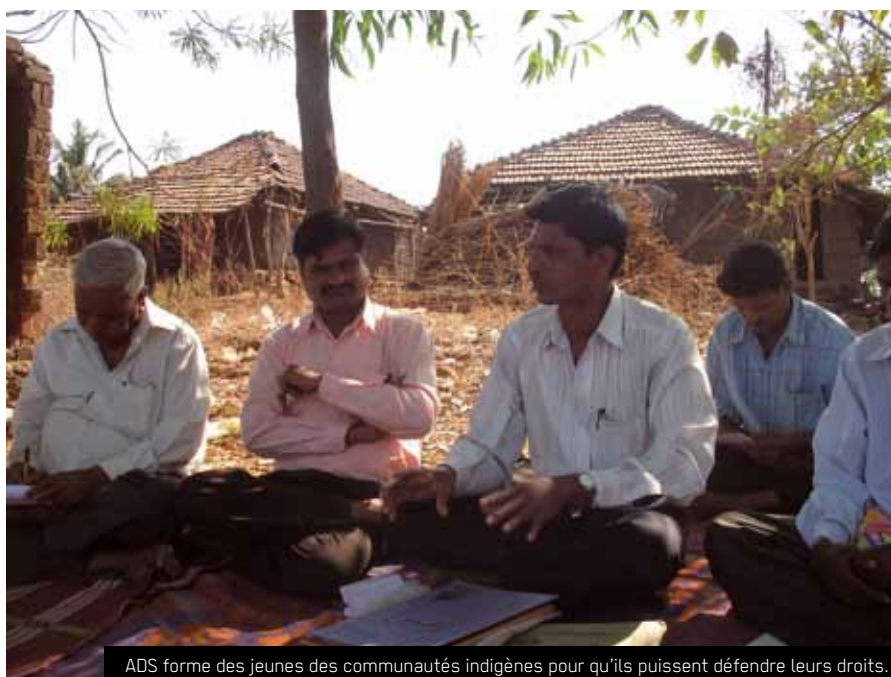
ADS forme des jeunes des communautés indigènes pour qu'ils puissent défendre leurs droits.

Le premier projet avec ADS se terminera à la fin de cette année; actuellement nous sommes en train de préparer une nouvelle collaboration dès janvier 2012.