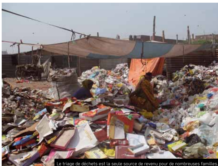
Le triage de déchets est la seule source de revenu pour de nombreuses familles.

L'organisation Chintan se bat depuis 1999 pour des politiques plus respectueuses de l'environnement et pour les droits des "récupérateurs" de déchets dans la capitale. Le travail très diversifié de l'équipe de Chintan