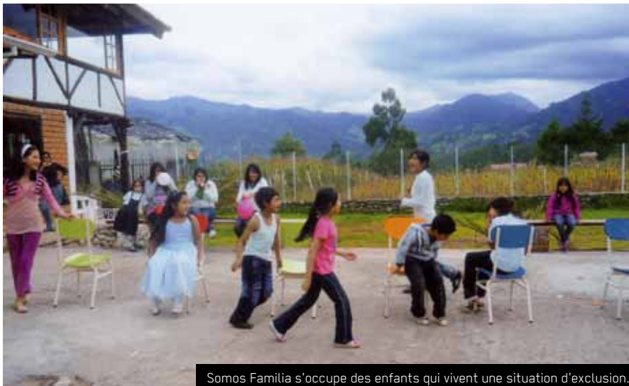
Somos Familia s'occupe des enfants qui vivent une situation d'exclusion.

Pendant toute la durée de l'action, les animateurs et responsables de Somos Familia vont rencontrer les familles, que ce soit en prison ou à l'extérieur, pour échanger avec elles sur les avancées et les difficultés rencontrées par les enfants. Mais cette action ne se limite pas au seul appui des enfants, elle a aussi une vocation de sensibilisation des institutions de l'Etat et de la population. En effet, il est essentiel que la société prenne conscience de la situation des prisonniers et de l'impact que cela a sur les enfants.