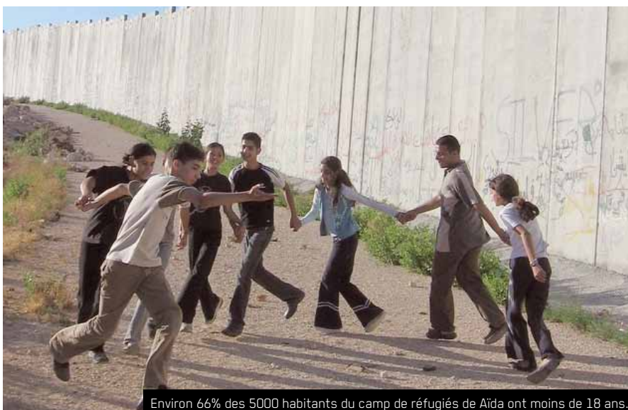
Environ 66% des 5000 habitants du camp de réfugiés de Aïda ont moins de 18 ans.