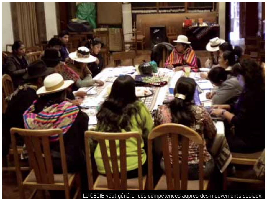
Le CEDIB veut générer des compétences auprès des mouvements sociaux.