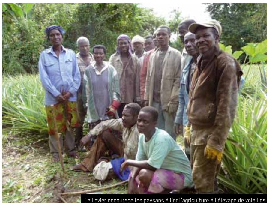
Le Levier encourage les paysans à lier l'agriculture à l'élevage de volailles.

Le nouveau programme triennal vise à promouvoir des activités génératrices de revenus, d'accompagner les paysans à s'organiser en groupements et de les sensibiliser à des pratiques écologiques.