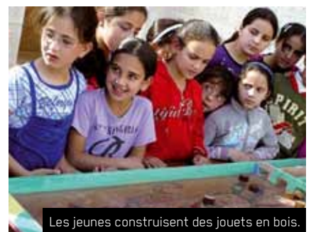
Les jeunes construisent des jouets en bois.

Le Centre Alrowwad est un centre culturel et de formation, situé dans le camp de réfugiés d'Aïda. Fondé en 1998, Alrowwad (Pionniers pour la vie) travaille en faveur du développement de l'enfant, de la jeunesse et de la femme par le biais de programmes pédagogiques et artistiques. Un des objectifs principaux est d'offrir aux jeunes du camp un espace dans lequel ils peuvent surmonter le stress en développant leur créativité par la voie d'activités non-violentes (le théâtre, la danse, la photographie et le sport). Le Centre gère également une ludothèque mobile destinée aux enfants et organise des festivals de cinéma en plein air. Tous ces éléments font partie du concept de "Belle Résistance" développé par Alrowwad. En mettant en