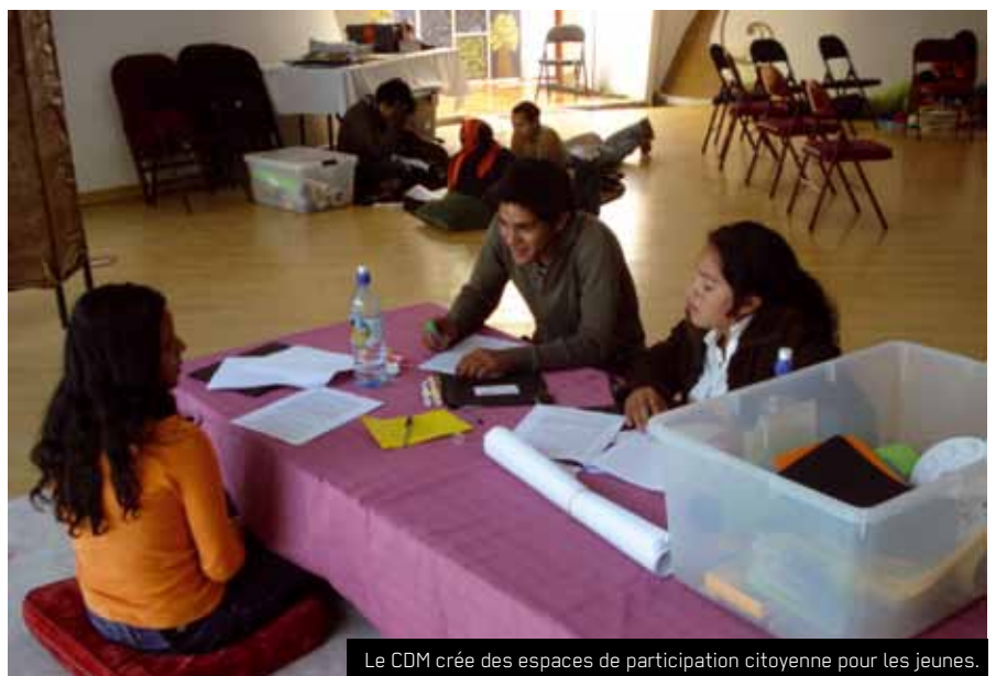
Le CDM crée des espaces de participation citoyenne pour les jeunes.

Le Centre des Droits pour les Femmes (CDM) promeut le renforcement de l'autonomie, de la justice et de l'exercice des droits des femmes au Honduras. Il agit surtout contre la discrimination et la violence envers les femmes, en