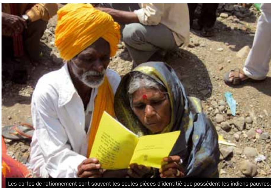
Les cartes de rationnement sont souvent les seules pièces d'identité que possèdent les indiens pauvres.

de l'Etat et d'autres personnalités qui ont promis leur soutien aux revendications des travailleurs. Santulan travaille depuis plusieurs années sur ces dossiers: le droit des enfants à l'éducation jusqu'à 18 ans, l'accès aux cartes de rationnement et aux distributions de denrées alimentaires, le droit d'obtenir des lots de terrains de l'Etat pour y construire des maisons (comme prévu par la loi), la création de centres médicaux dans les carrières, l'assurance maladie, les pensions pour les travailleurs et un salaire minimal. Le fait même que des hautes personnalités aient assisté à l'assemblée, indique d'un côté que le travail de lobbying poursuivi par Santulan commence à porter ses fruits et, de l'autre, que Santulan est maintenant considéré comme une entité dont on doit tenir compte.