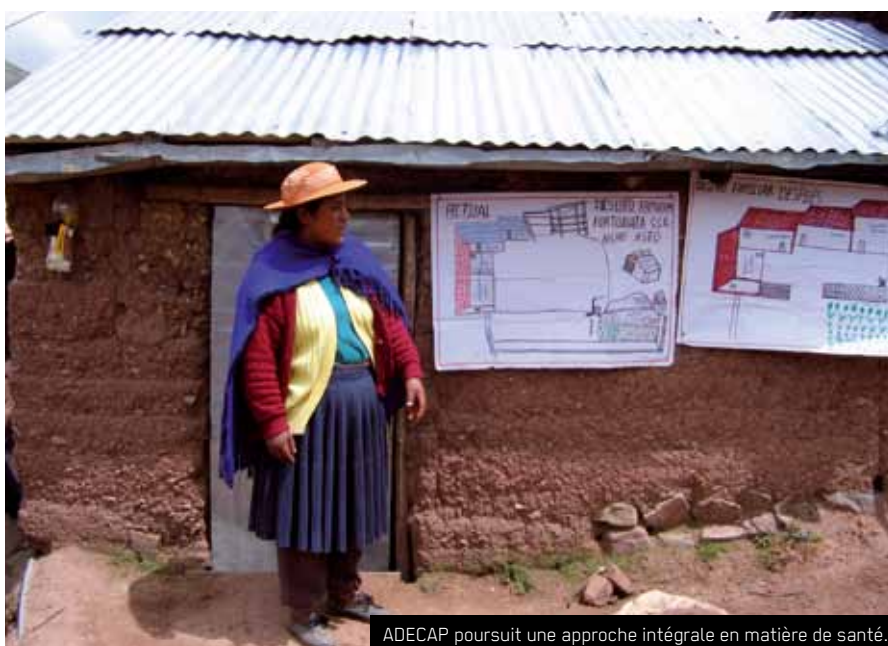
ADECAP poursuit une approche intégrale en matière de santé.

ADECAP lutte contre la pauvreté et la marginalisation, ainsi que pour la promotion du développement intégral des communautés indigènes quechuas. Basée sur une approche intégrale, elle travaille en collaboration avec les familles, les autorités communautaires et, dans la mesure du possible, avec les services locaux du Ministère de la