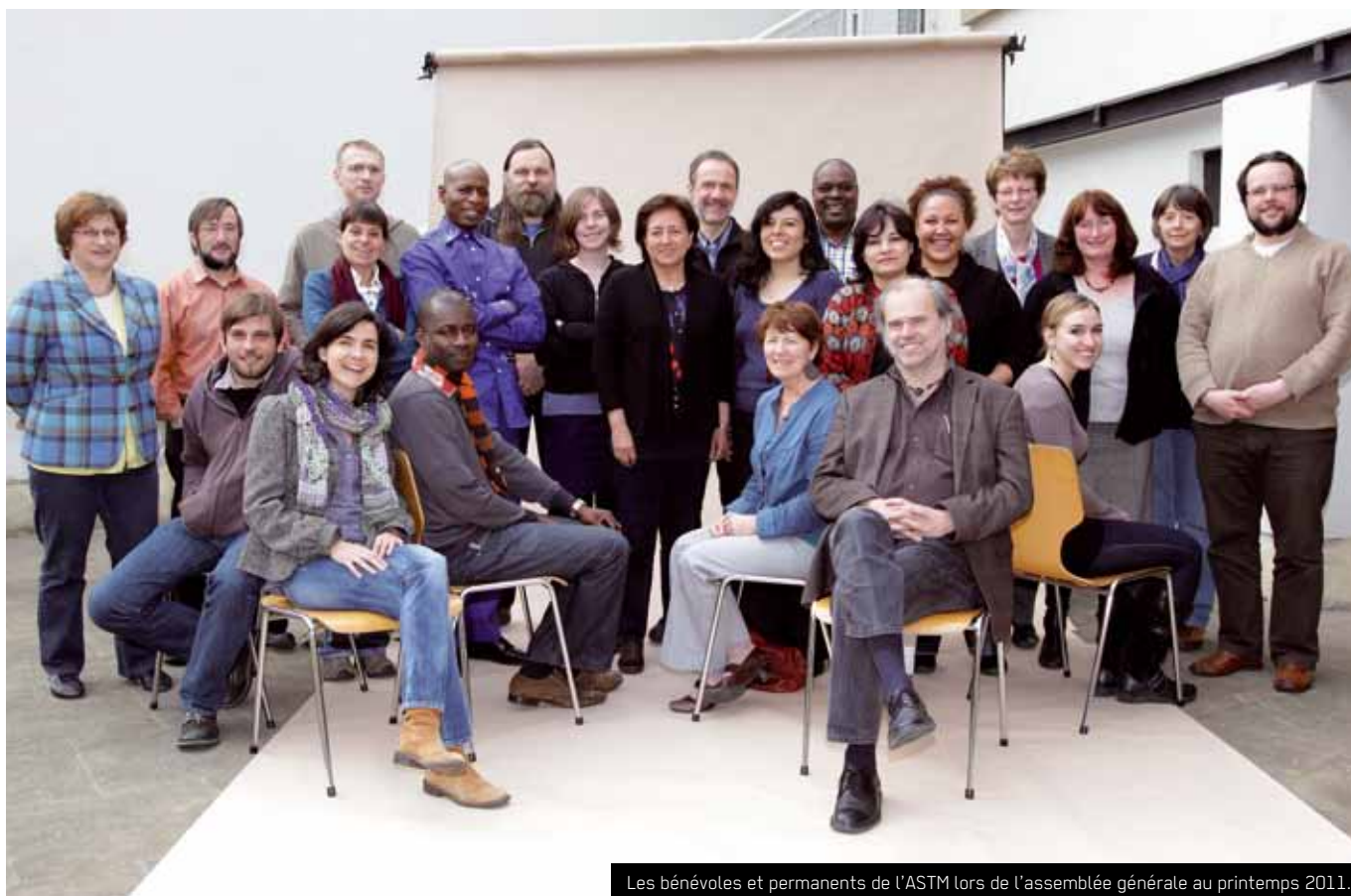
Les bénévoles et permanents de l'ASTM lors de l'assemblée générale au printemps 2011.

LU 71 1111 0102 3550 0000 (BIC: CCPLULLL) avec mention "abo bp3w", sans oublier votre nom et adresse complète. Cet abonnement vous donne droit à 8 numéros qui paraissent en général tous les deux mois.