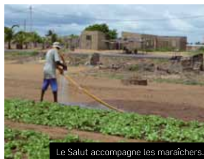
Le Salut accompagne les maraîchers.

L'ONG Le Salut s'engage depuis 2004 en faveur des communautés rurales et urbaines de la ville de Lomé et des alentours. Le travail consiste en la formation et l'accompagnement des communautés dans un processus participatif pour les aider à sortir de la pauvreté. Les programmes de Le Salut dans les domaines