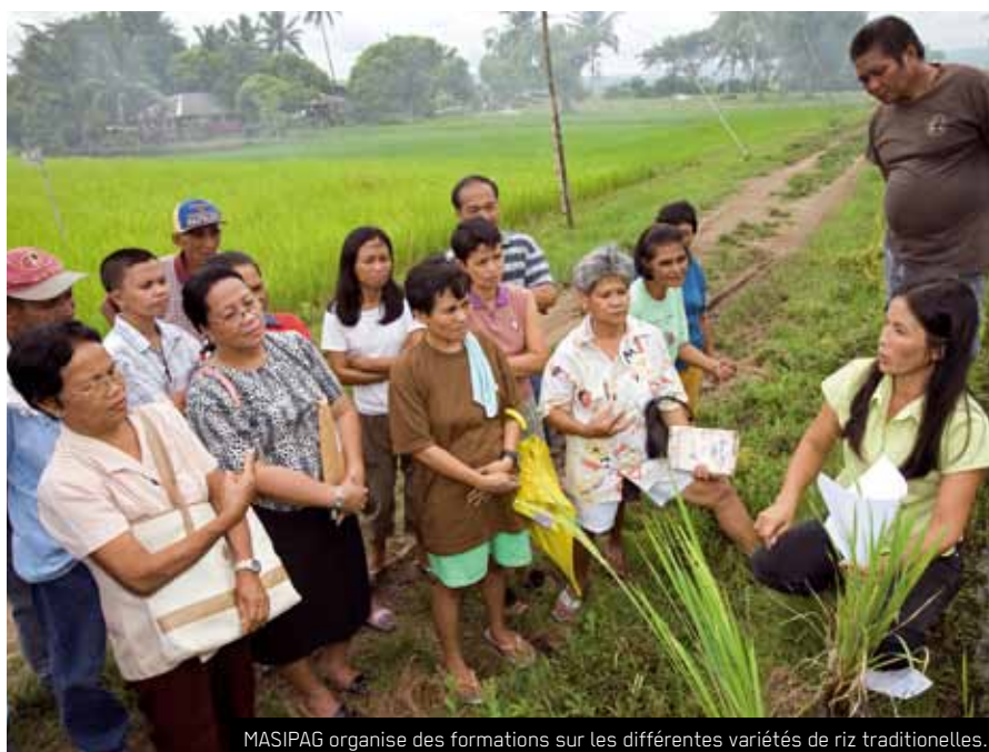
MASIPAG organise des formations sur les différentes variétés de riz traditionnelles.