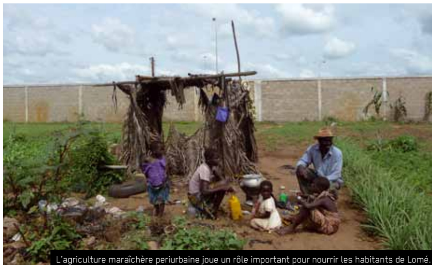
L'agriculture maraîchère périurbaine joue un rôle important pour nourrir les habitants de Lomé.

Le projet en cours poursuit un double objectif. Premièrement, il vise le renforcement des capacités techniques et organisationnelles des producteurs avec un accent sur la promotion des techniques biologiques (l'utilisation de biopesticides et de fumure organique), ainsi qu'une meilleure valorisation des produits destinés aux marchés locaux et régionaux. Deuxièmement, il est prévu de sensibiliser les ménages de deux quartiers de Lomé sur la gestion durable des ressources naturelles, dans l'optique de mettre en place un système de recyclage des ordures et déchets urbains, dont une partie pourrait servir les maraîchers comme compost.