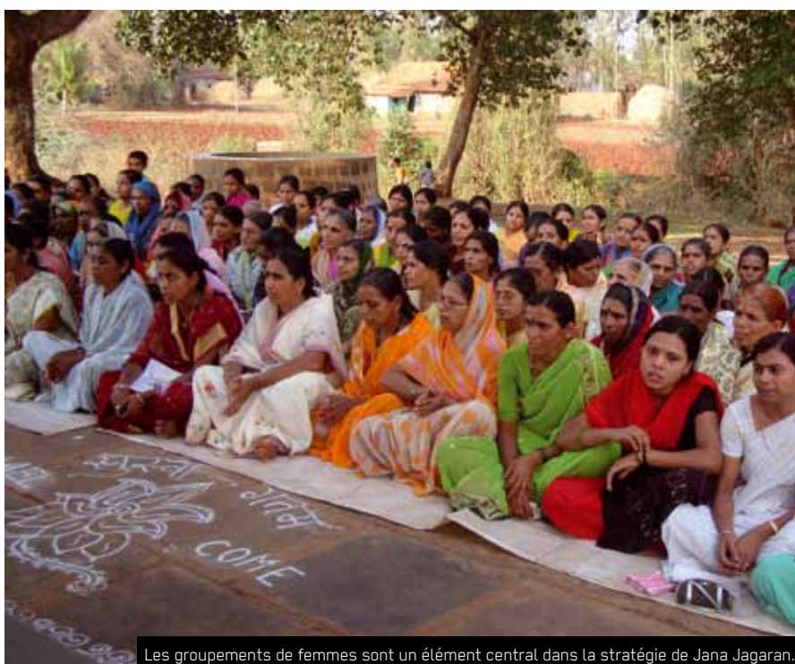
Les groupements de femmes sont un élément central dans la stratégie de Jana Jagaran.

L'Inde connaît depuis une vingtaine d'années une croissance moyenne du PIB de 5,8% (8,6 % en 2010), mais en dépit de cela, elle reste à la 138ème place du classement du PIB par habitant. Les disparités de revenu n'ont pas cessé d'augmenter, autant entre les différents états du pays que parmi les habitants: le PIB des états les mieux situés est plus de trois fois supérieur à celui des états les plus pauvres. Les conséquences de cette situation sont graves, surtout pour les enfants et les femmes qui souffrent de malnutrition (plus de 40%) et de graves problèmes de santé.