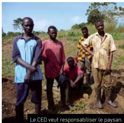
Le CED veut responsabiliser le paysan.

Si le Togo compte aujourd'hui parmi les pays les plus pauvres du monde, ce n'est pas faute de bras à même de le hisser à un rang plus respectable. Il manque surtout de cohérence dans la planification et la gestion de priorités au niveau des responsables politiques. Aujourd'hui, le Togo occupe la 159 ème place sur 182 pays selon le classement du Programme des Nations Unies pour le Développement (PNUD). Autre fait d'actualité, le Fonds Monétaire International (FMI) vient de rendre public que le Togo a atteint le point d'achèvement de l'initiative Pays Pauvres Très Endettés (PPTE). La couche rurale de la population est la première victime de cette gestion, ce qui se traduit par le manque d'infrastructures locales pour satisfaire les besoins les plus élémentaires.