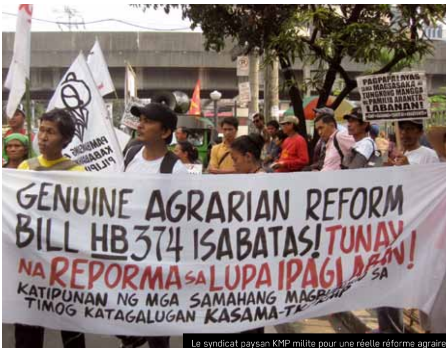
Le syndicat paysan KMP milite pour une réelle réforme agraire