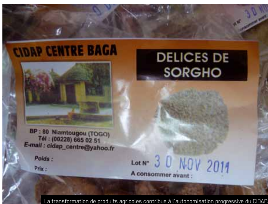
La transformation de produits agricoles contribue à l'autonomisation progressive du CIDAP.

Depuis 2010, le CIDAP a reçu l'autorisation officielle du gouvernement de former des jeunes techniciens agricoles suite à une évolution politique plus positive au Togo. Le programme des Nations Unies pour le développement (PNUD) et le Fonds pour l'Environnement mondial (FEM) se sont intéressés au