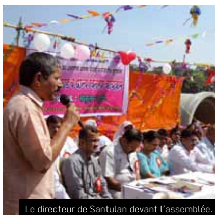
Le directeur de Santulan devant l'assemblée.

Chaque année, le syndicat des carriers créé en 2005 avec l'aide de Santulan, organise une assemblée qui a pour objectif de mettre en avant les revendications du secteur. Celle de juillet 2011 a vu la participation de deux Ministres