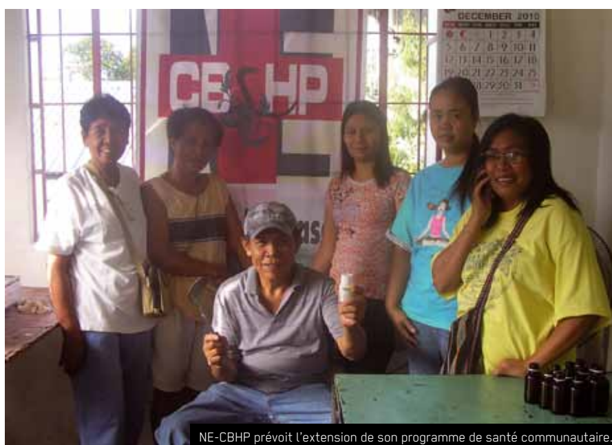
NE-CBHP prévoit l'extension de son programme de santé communautaire.

place des systèmes de santé de base gérés d'une manière autonome par les organisations locales, afin de répondre à l'absence de services adéquats de l'Etat. Pendant les dernières années, NE-CBHP a dû adapter son programme de travail normal pour organiser des activités de suivi des violations des droits humains et l'accompagnement des communautés traumatisées par les atrocités perpétrées par les unités de l'armée stationnées dans la région.