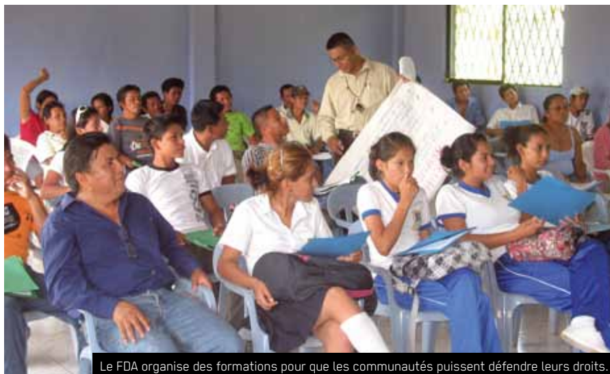
Le FDA organise des formations pour que les communautés puissent défendre leurs droits.