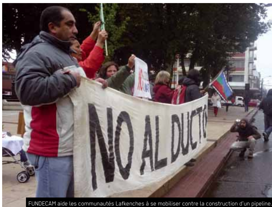
FUNDECAM aide les communautés Lafkenches à se mobiliser contre la construction d'un pipeline.

de Quele et de Mehuin, affectées par la construction du pipeline qui va transporter les déchets d'une des plus grandes usines de cellulose du pays vers la mer en passant par leurs terres ancestrales. Les tractations et les démarches entreprises depuis des années par de nombreuses organisations pour empêcher la construction du pipeline n'ont pas abouti. Mais pour les communautés, la lutte n'est pas finie pour autant. Elles continuent à se mobiliser pour faire en sorte que les déchets toxiques ne traversent pas leurs cultures et ne soient pas déversés dans la mer, là où ils pêchent !