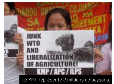
Le KMP représente 2 millions de paysans.

Le KMP, une organisation qui représente 2 millions de paysans et de travailleurs agricoles, revendique depuis 1985 des politiques gouvernementales qui répondent aux besoins des paysans : l'accès à la terre, la mise à disposition des moyens de production et des crédits abordables. Le mouvement s'engage aussi pour la promotion de l'agriculture durable, qui prône des techniques agricoles biologiques et l'utilisation de variétés de riz traditionnelles. Le KMP