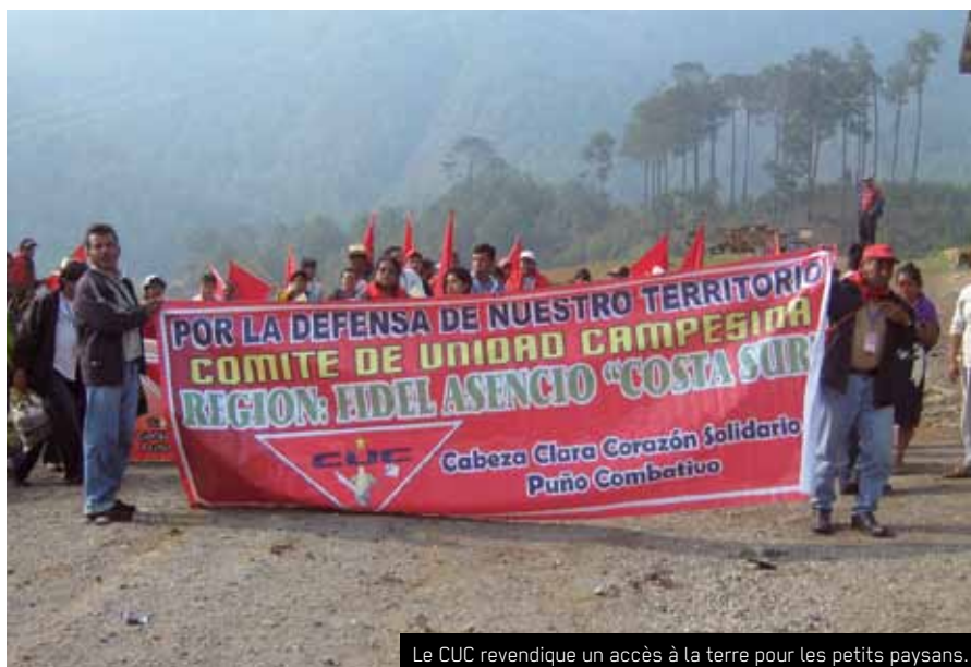
Le CUC revendique un accès à la terre pour les petits paysans.