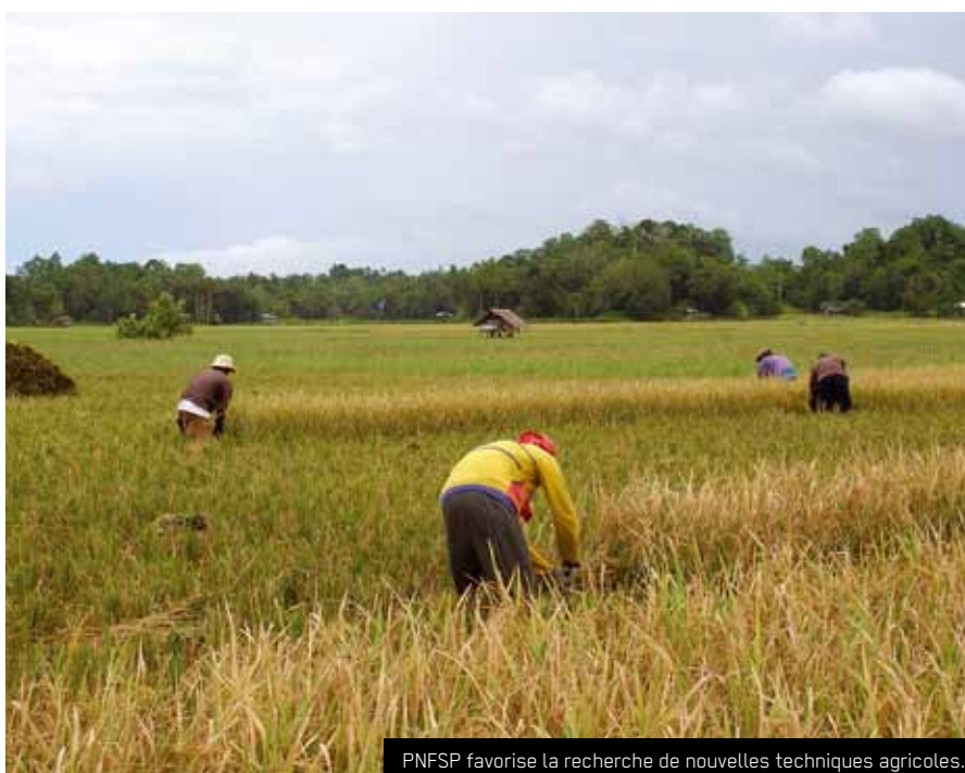
PNFSP favorise la recherche de nouvelles techniques agricoles.

Le réseau PNFSP a été créé en 2005 par 25 ONG qui travaillent dans le domaine de la souveraineté alimentaire dans le pays entier. Il veut renforcer les programmes de souveraineté alimentaire de ses membres par voie d'échanges d'informations et d'expériences. En outre, PNFSP aide ses membres avec la recherche de financement pour leurs projets et avec le renforcement de leurs capacités institutionnelles.