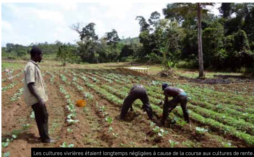
Les cultures vivrières étaient longtemps négligées à cause de la course aux cultures de rente.