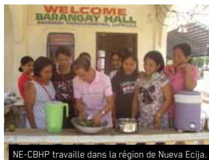
NE-CBHP travaille dans la région de Nueva Ecija.

L'objectif principal de NE-CBHP est d'aider les communautés rurales de la province de Nueva Ecija à mettre en