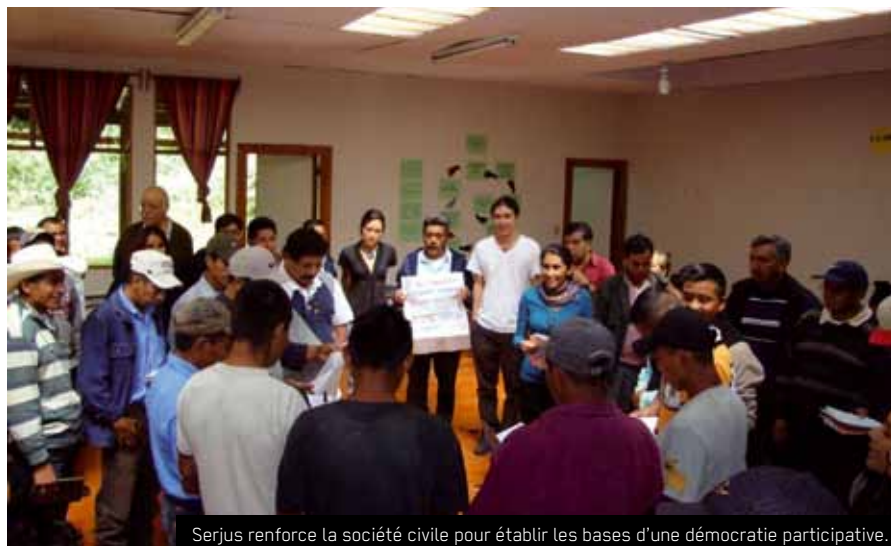
Serjus renforce la société civile pour établir les bases d'une démocratie participative.