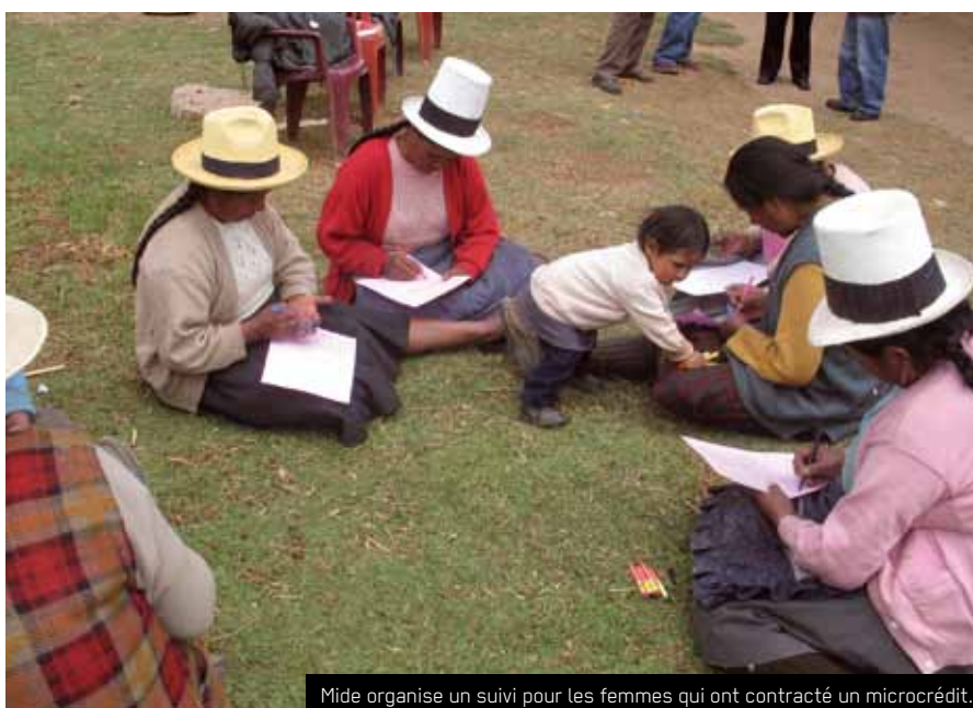
Mide organise un suivi pour les femmes qui ont contracté un microcrédit.

MIDE promeut le microcrédit comme un outil de développement économique et personnel pour les femmes indigènes vivant dans l'extrême pauvreté. Les microcrédits sont accompagnés de formations adéquates et les femmes bénéficient d'un suivi régulier. MIDE porte notamment beaucoup d'attention à la promotion du rôle social des femmes.