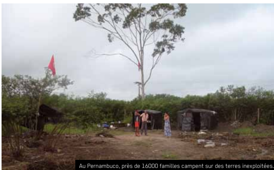
Au Pernambuco, près de 16000 familles campent sur des terres inexploitées.

Dans ce contexte, le MST continue à lutter pour une vraie réforme agraire qui assure aux paysans l'accès à la terre et la production d'aliments pour le marché interne. Même s'il y a eu des avancées sociales importantes pendant les huit années du gouvernement de Lula, la réforme agraire se fait toujours attendre. Actuellement, on estime qu'il y a 240000 familles sans terres au Per-