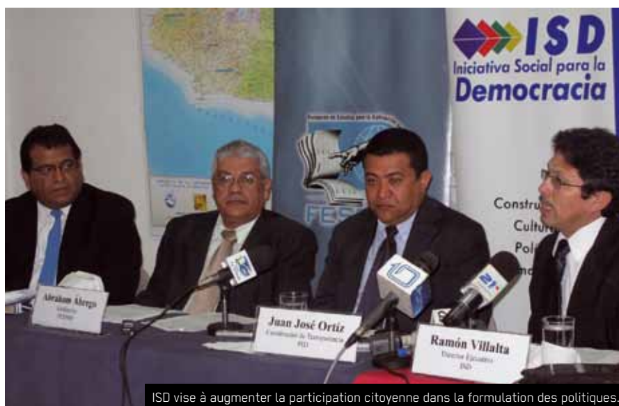
ISD vise à augmenter la participation citoyenne dans la formulation des politiques.

Depuis 2009, l'ISD a décidé d'étendre son action aux trois niveaux territori-