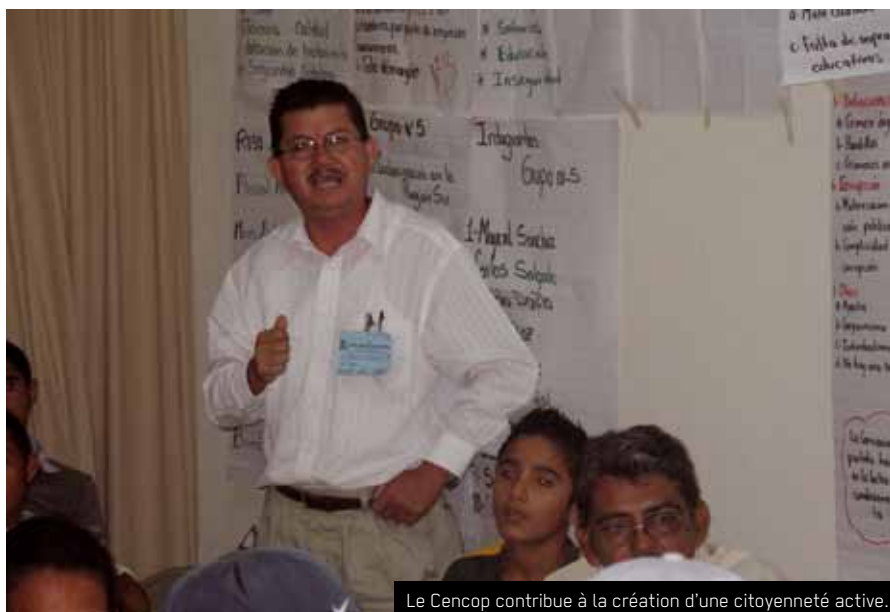
Le Cencop contribue à la création d'une citoyenneté active.

Bien qu'en 2009, le climat politique ait empêché le déroulement de certaines activités prévues, 2010 a été une année de grandes avancées. Les activités de formation ont connu un intérêt croissant avec un nombre des participants qui a augmenté et dépassé les indicateurs prévus. On a constaté d'autre part une croissance qualitative et quantitative de la population dans le mouvement social qui demande une meilleure participation dans la vie politique du pays et le respect des droits humains. Cela correspond exactement à l'objectif de contribuer à la création d'une citoyenneté active. Par exemple, dans le département d'Olancho, le projet compte actuellement des participants venant de 23 municipalités, contre 10 en 2009.